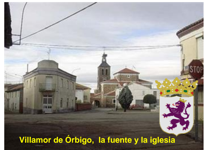
Villamor de Órbigo, la fuente y la iglesia