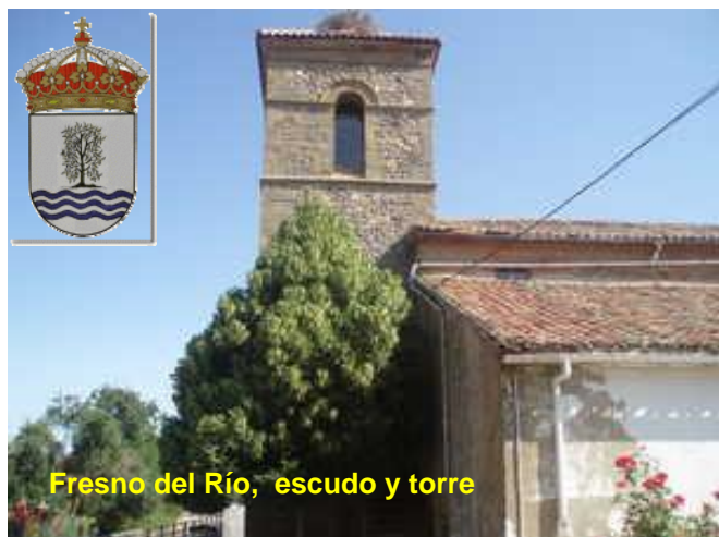
Fresno del Río, escudo y torre

El proceso de su martirio es similar al de los demás Oblatos de Pozuelo. Los tres pasos de su corto vía crucis fueron los siguientes: es detenido y hecho prisionero en la propia casa-seminario con toda la comunidad oblata. Aquella misa noche, "saca" en el mismo convento, junto con seis compañeros más y el padre de familia Cándido Castán. Fusilamiento en la madrugada del 24 de julio de 1936, en la Casa de Campo de Madrid.