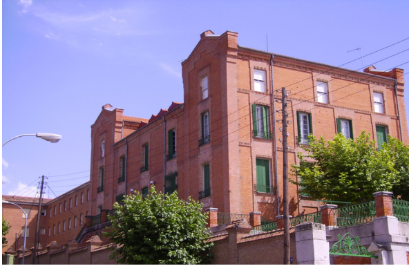
Escolasticado de Pozuelo, escenario de los hechos