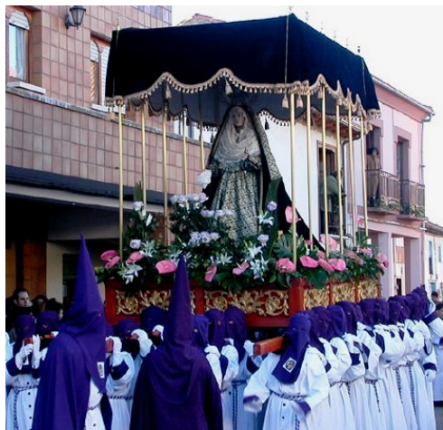
Religiosidad: Semana Santa en Santa Marina del Rey

vivencias que he tenido en mi familia y, también, por el trato que he tenido con los Oblatos, Congregación en la estuve algún tiempo.