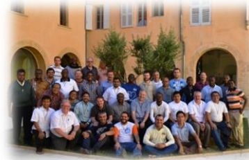
Participantes en el I Congreso de Vocaciones Oblatas

En este mes de noviembre, en el que se celebra la memoria litúrgica de los Mártires Oblatos de España, la oración vocacional quiere alimentar la esperanza. El Espíritu de Dios es más fuerte que el espíritu del Mundo. Los participantes en el I Congreso Vocacional Oblato de Aix-en-Provence, oblatos procedentes de distintas partes del mundo, concretan esta esperanza en la fuerza del Espíritu para nuestra Congregación.